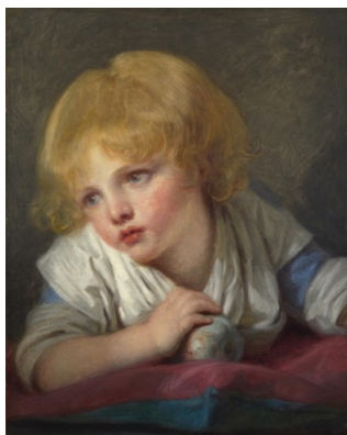
Afbeelding 3: Jean Baptiste Greuze. A girl with an apple (late 18 de eeuw). olie op canvas, 40.6 x 32.1 cm. National Gallery london