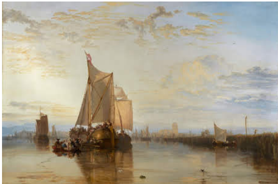
Afbeelding 4: William Turner. The Dort Packet-Boat from Rotterdam becalmed (1818). Olie op canvas, 157× 233cm. Yale Center for British Art