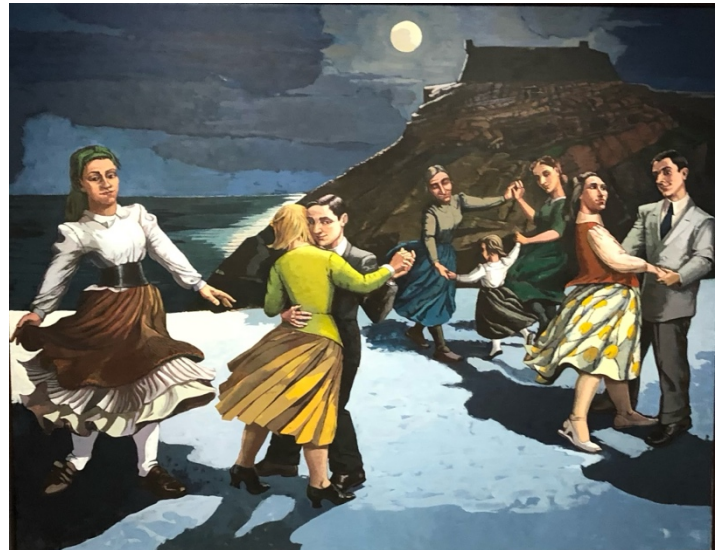
Afbeelding 9: Paula Rego, The Dance , 1988. Acrylverf op papier op doek, 212,6x274 22