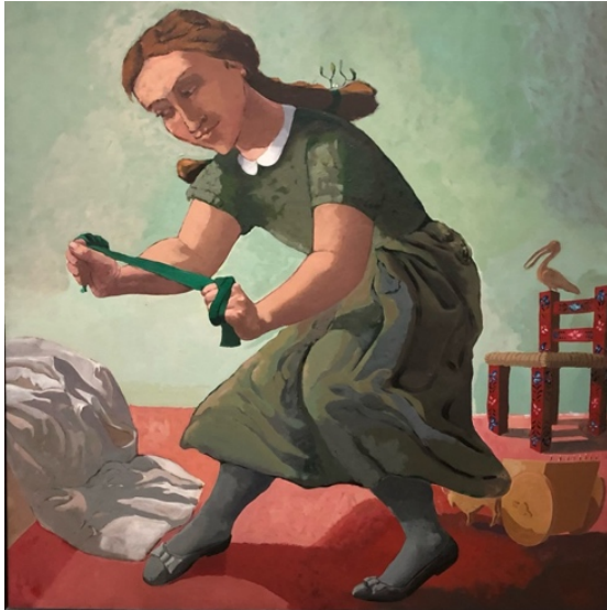
Afbeelding 8: Paula Rego, The little Murderess 1987, acrylverf op papier op doek, 150x150 cm 21

echtgenoot Victor Willing, die door de ziekte multiple sclerose van haar afhankelijk wordt. Het is een passende koppeling naar de volgende zaal waarin het veranderende rollenspel tussen van man en vrouw verder vorm krijgt.