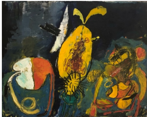
Afbeelding 4: Paula Rego, Salazar Vomiting the Homeland , 1960. Olieverf op doek, 94x120 cm 8

De tentoonstelling begint met het enige echt expressionistische schilderij van de tentoonstelling Salazar Vomiting the Homeland (1960) (afb. 4). Je ziet drie organische vormen in felgeel en rood op een dreigend blauw-zwarte achtergrond. De fallusachtige figuur links visualiseert de overgeevende dictator Antonio de Oliveira Salazar. Rechts van hem zie je twee organische figuren met een vaginale referentie die vrouwen moeten voorstellen. Dit vroege werk van de 25-jarige Paula was een expliciete aanklacht van het autoritaire bewind van Salazar. Volgens kunsthistorica Memory Holloway getuigt de titel alleen al van Rego's absolute afschuw voor de leider van de natie, zijn beleid en zijn persoon. 7