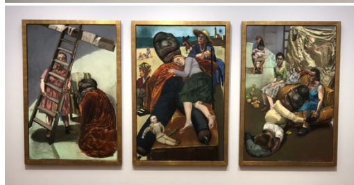
Afbeelding 10: Paula Rego, The betrothal:Lessons:The Shipwreck after Mariage a la Mode by Hogarth(1999) , 3 werken op pastel op papier op aluminium, 165 x 500 cm. 29