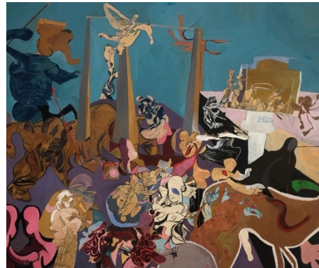
Afbeelding 5: Paula Rego, Julieta , 1964. Grafiet en papier op doek, 152x183 cm. 9